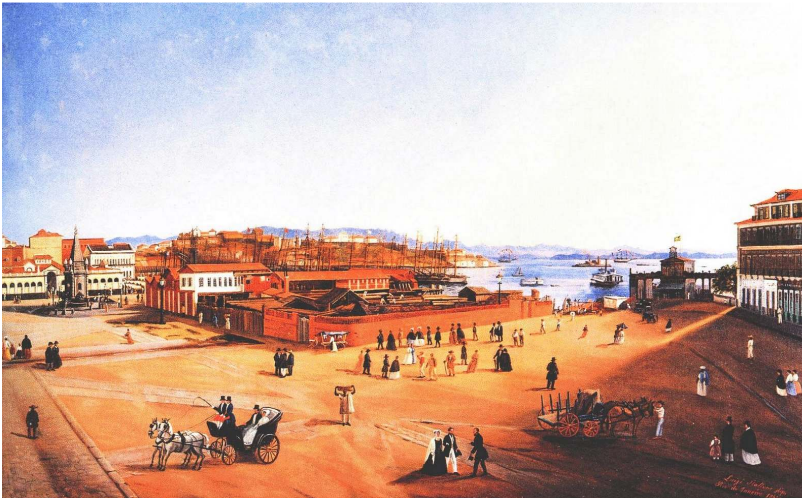
Largo do Paço, Rio de Janeiro, em 1865, Luigi Stallone, Museu Histórico da Cidade do Rio de Janeiro