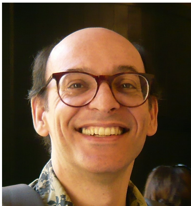
Manuel Pedro Ferreira

(séculos XII-XVII) (Lisboa-Guimarães, 2012); e Musical exchanges, 1100-1650: Iberian con-