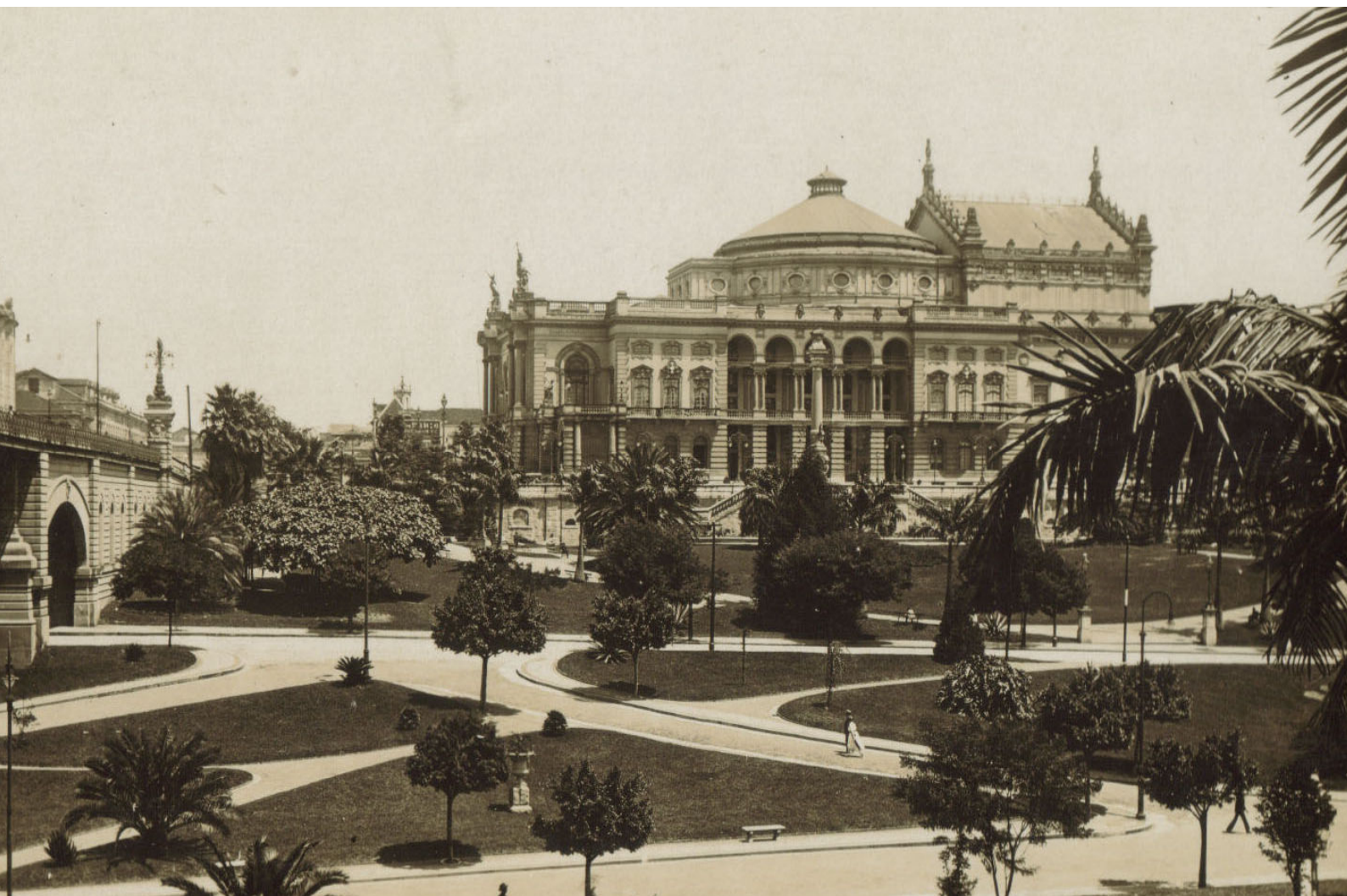
Teatro Municipal de São Paulo

Núcleo de Estudos da História da Música Luso-Brasileira